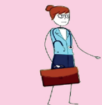
Médecin du travail